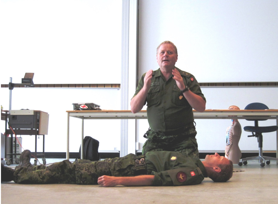
Tekst af Erik Ravn Gregersen

Da vi er ved at få lavet et Jubilæumsskrift i anledningen af hjemmeværnets 60-års Jubilæum, mangler vi rigtig mange oplysninger om sjove episoder fra forskellige kurser som I har deltaget i.